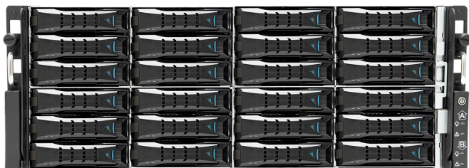
Сервер Тиара-А4 / Вид спереди